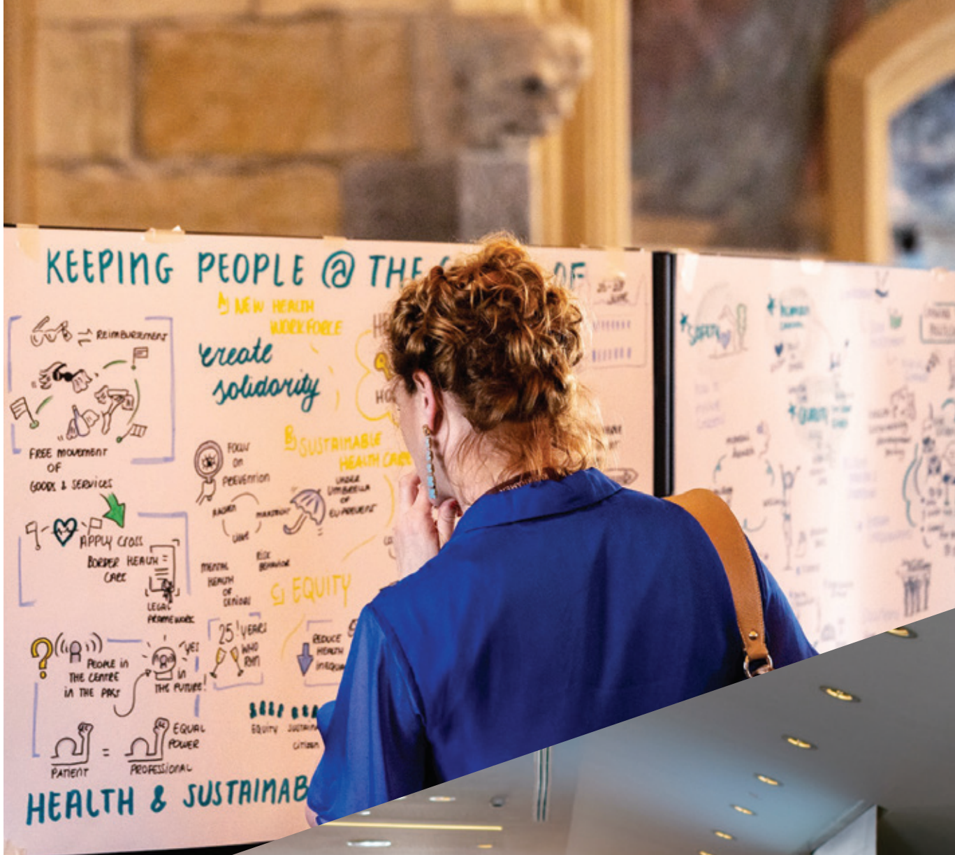
De resultaten van de discussies zijn samengevat in getekende beelden. © ViaDesk