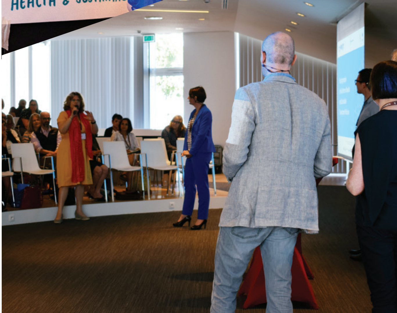
Burgertop ter voorbereiding van de WHO-conferentie.