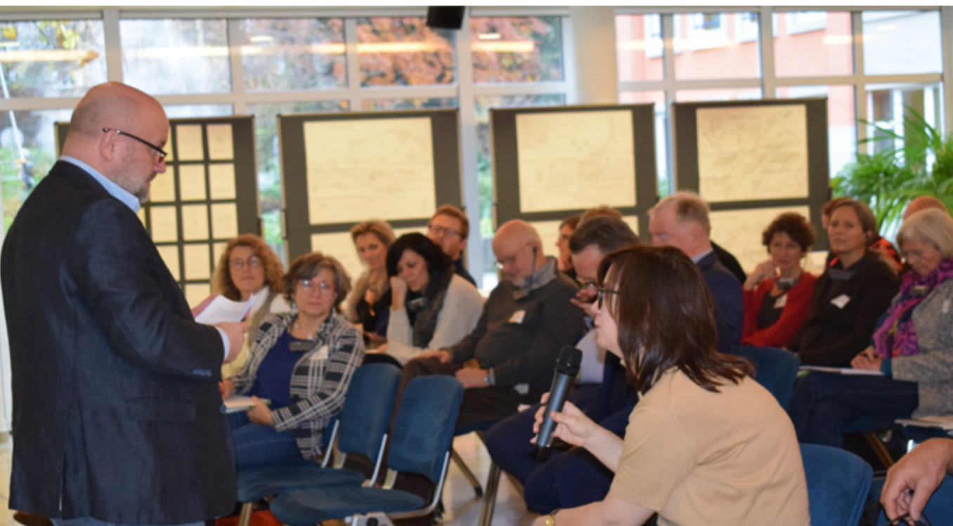
Dankzij de moderatie tijdens het forum kon het debat worden gestimuleerd en op een constructieve manier worden gevoerd.

Nog een Highlight van 2019 was het 3LP projectforum 'Het bebouwde landschap: tussen betaalbare huisvesting en betonstop - Grijs en groene infrastructuur in een grensoverschrijdende dialoog' , dat in november in Eupen heeft plaatsgevonden. Met zijn fora pakt het Drielandenpark toekomstgerichte thema's door duurzame ontwikkeling aan. Zoals gewoonlijk werden spannende projecten uit de EMR op het programma gezet om hun aanpak te komen voorstellen. Uit de discussie tussen regionale en lokale actoren in het forum bleek wel dat er nog veel samenwerking nodig is - niet alleen over landsgrenzen heen, maar ook sectorgrenzen - om de maatschappelijke verandering van de stedelijke groei vorm te geven als een duurzame, klimaatvriendelijke gebiedsontwikkeling. Waar de samenwerking slaagt, worden wel degelijk nieuwe ruimtes met een hoge aantrekkelijkheid en levenskwaliteit gecreëerd.